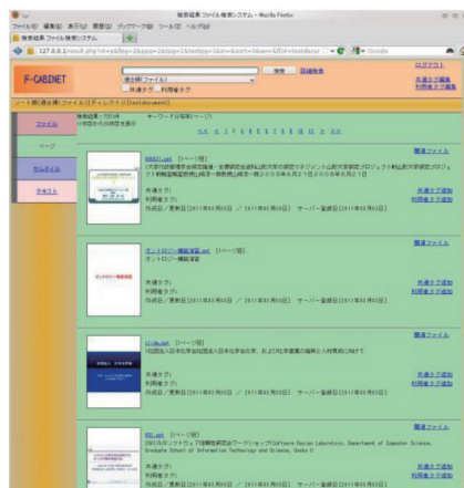
キーワードの該当ページのみ表示 「ページ表示モード」