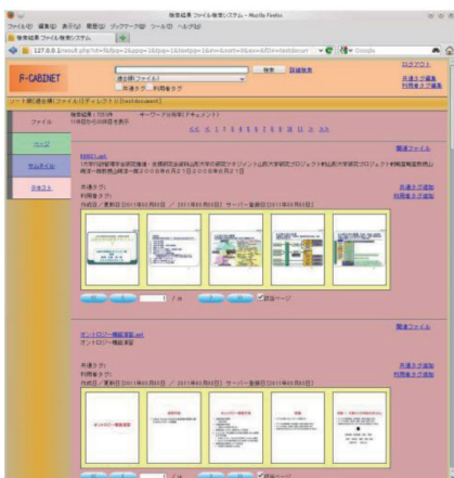
1つのファイルを5ページずつ表示 「ファイル表示モード」

さらに、検索結果に関連したファイル（画像など文字情報のないファイルを含む）を表示する機能も備えています。