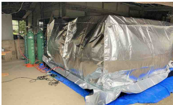
図1. 炭酸ガスくん蒸処理の様子

定植後にハウス外からの侵入対策として、ミヤコバンカー等の天敵資材や防虫ネットを併用することにより、長期間にわたりハダニ類の発生を抑制できる（図2）。