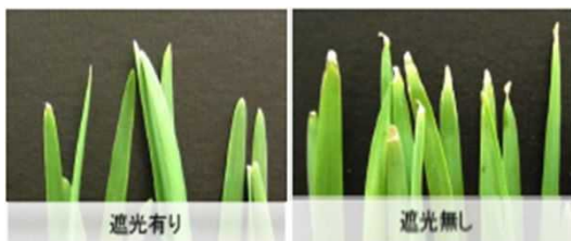
図3 葉先枯れの症状