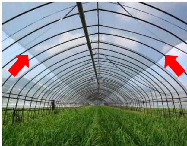
図1 天井中央部に被覆 (南北棟ハウス)