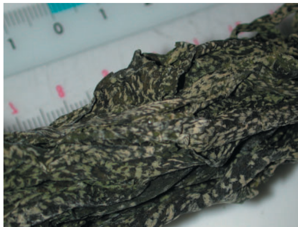
図 1 表面に白い斑点が生じた乾燥ワカメ

持ち込まれた乾燥ワカメ（長さ 31cm 重さ 17.1g、以下検体と称す）は、葉状部全形ではなく、先端を含んだ上部側のみであった。葉体の厚さと横幅から、老成した個体と判断された。検体には肉眼で白い斑点が全面に見られた（図 1）。そこで、検体表面の斑点の長さや幅を、任意の 10 カ所についてノギスで測定した。その後、検体を室温で滅菌海水に 1 時間浸して戻したのち、全面を光学顕微鏡で観察した。多くの部分で検体両面に毛巣とよばれる器官と、毛巣から伸長した複数の毛 4) に付着した大量の珪藻類が観察された。そこで、毛巣の直径と配置間隔、毛の本数と幅を測定した。また、付着している珪藻類を顕微鏡で観察し、細胞の長さや最大幅を 10 個体について測定した。