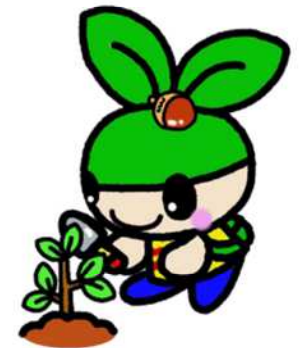
森づくりマスコット キャラクター