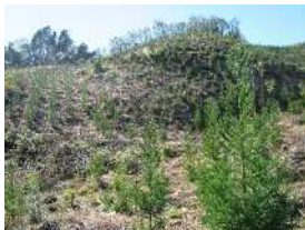
費用を抑えた再造林