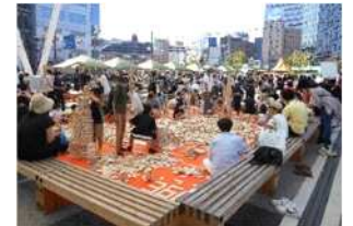
木材普及イベント