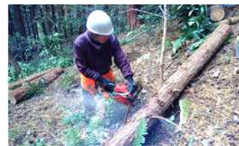
経営放棄林の間伐