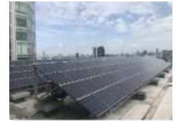
太陽光発電(渋谷区庁舎)