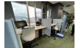
フリーアドレス席(三豊市庁舎)