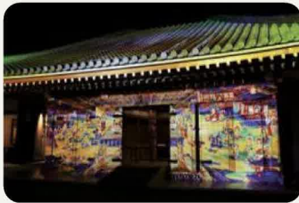
富貴寺大堂 (常設展示室)