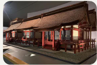
宇佐神宮本殿模型(宇佐八幡の文化)