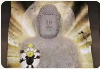
熊野磨崖仏 (エントランス)