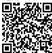
インターネット(電子申請)による受験申込みの流れ