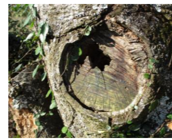
A児が発見した木の幹の穴