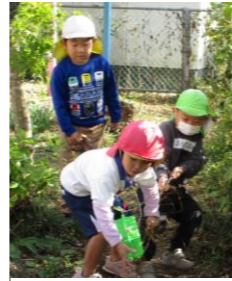
蔓を引っ張るA児と、一緒に引っ張る違う園の友達