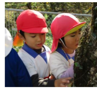
同じ園のB児と一緒に大きな穴をのぞき込むA児