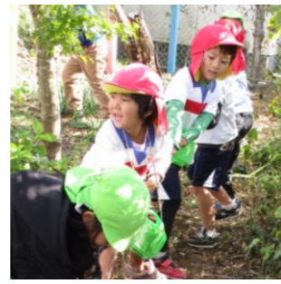
声援が聞こえ、ニコツとして園庭に目をやるA児