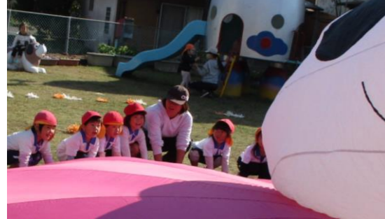
友達と曲に合わせて動き、パンダを出すことに成功したA児