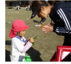
「見て、穴が開いてる」