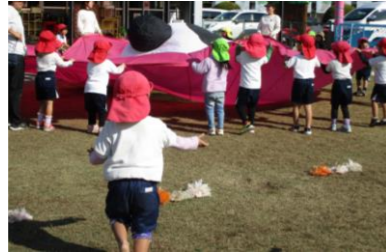
保育者からの言葉掛けで、バルーンをしている友達のところへ急いで走っていくA児