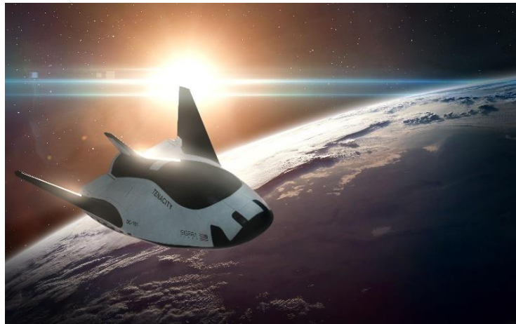
宇宙往還機 Dream Chaser イメージ

JAL、兼松、大分県、三菱 UFJ 銀行、東京海上日動、Sierra Space、Space Port Japan は、宇宙往還機 Dream Chaser®の活用検討に向けたパートナーシップ契約を締結しており、各者の連携のもと、大分空港を Dream Chaser のアジア拠点として活用することを目指し、実現に向けた取り組みを推進しています。