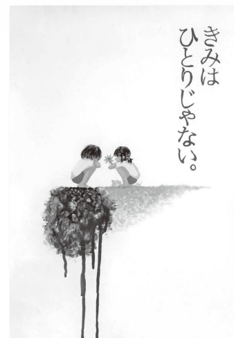
昨年度「人権ポスター」 最優秀作品 （高校・一般の部）