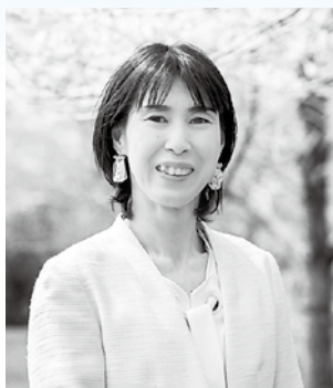
大分県人権教育・啓発推進協議会 人権啓発講師