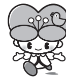
大分県 人権啓発イメージキャラクター 「こころちゃん」