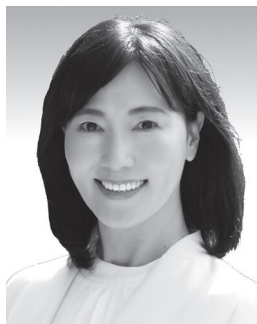
大分県人権教育・啓発推進協議会 人権啓発講師