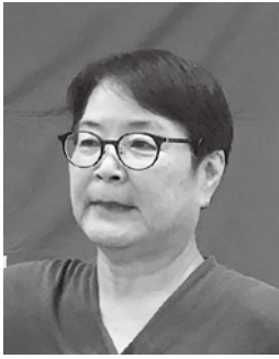
大分県人権教育・啓発推進協議会 人権啓発講師