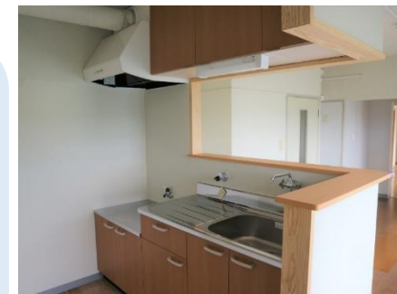
子育て世帯向け住戸の整備 (対面キッチンへの改修事例)