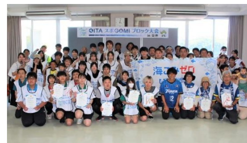
OITA スポGOMI ブロック大会