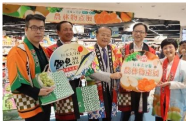
台湾プロモーション