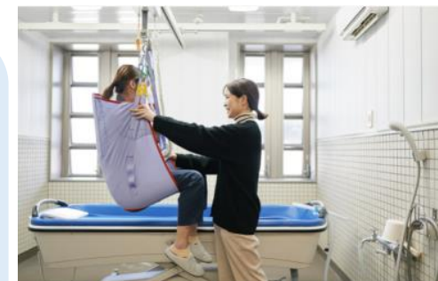
ノーリフティングケア (抱え上げない介護)