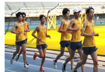
大学チームのスポーツ合宿