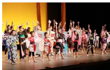
地域の芸術文化活動