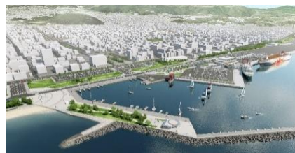
別府港再編イメージ図