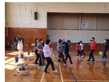
総合型地域スポーツクラブでの活動