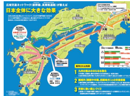
広域交通ネットワーク