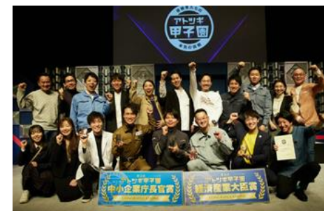
アトツギ甲子園決勝大会