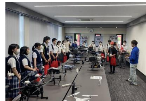
理工系人材育成に向けた企業訪問