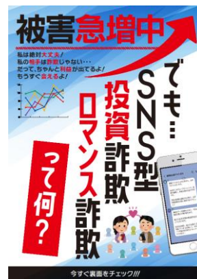
詐欺被害防止広報啓発