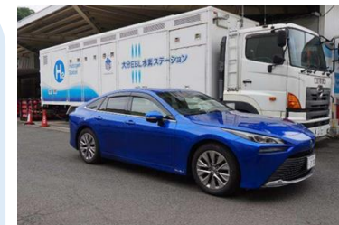
水素ステーションと 燃料電池自動車