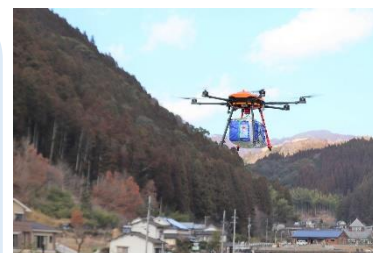
ドローンによる孤立集落への 救援物資配送訓練