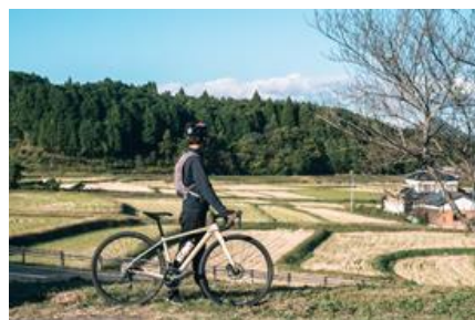
豊後高田市のアドベンチャー ツーリズムコース