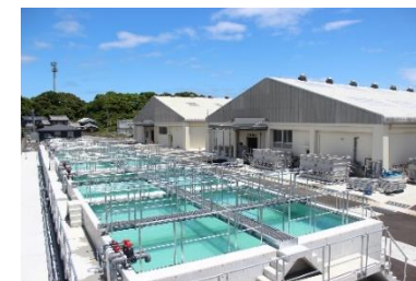
新たに整備した種苗生産施設