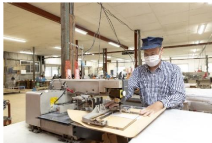
縫製現場での就労の様子