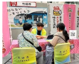
東京での移住相談会