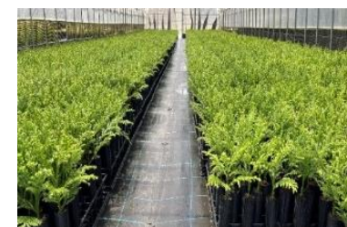
整備の進む早生樹育苗施設