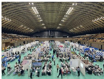
高校生向け企業説明会