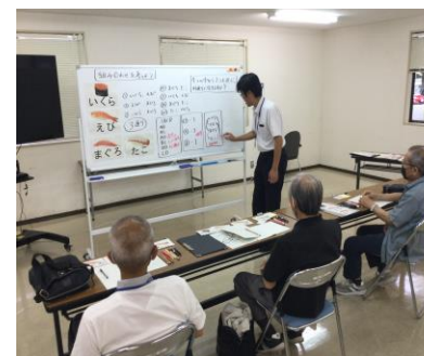
夜間中学模擬教室