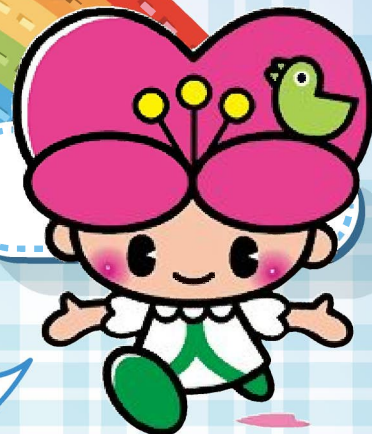
大分県人権啓発イメージキャラクター こころちゃん

働きやすい職場をつくることは、企業のイメージや、従業員のやる気の向上につながります。明るい職場づくり、企業の業績UPを目指しませんか。従業員の人権意識の低下は、企業にとって大きな損失です。分析チャートで、あなたの会社に一番適した方法を考えてみてくださいね。