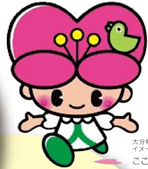
大分県人権啓発 イメージキャラクター こころちゃん

こころちゃんの部屋においてよ! http://www.pref.oita.jp/site/kokoro/