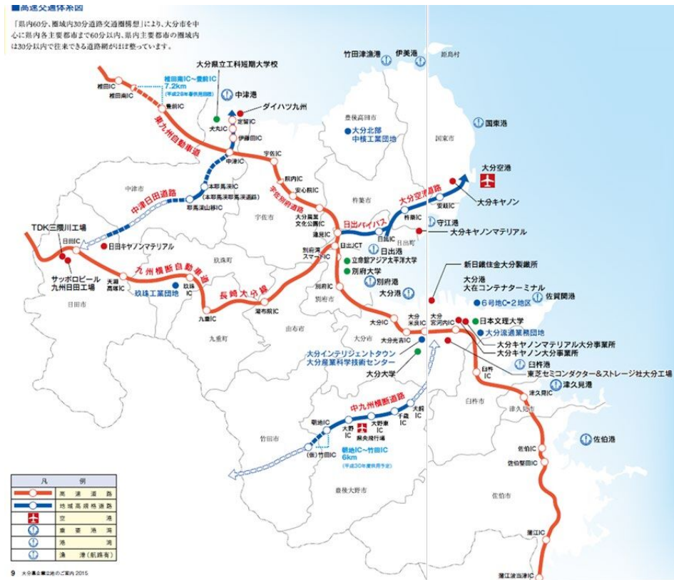
図表7 県内の主要交通インフラ及び支援機関等

さらに中小企業者やスタートアップを支援する、(公財)大分県産業創造機構(所在地:大分市)、大分県よろず支援拠点(所在地:大分市)、おおいたスタートアップセンター(所在地:大分市)、商工会(所在地:中津市、宇佐市安心院町・院内町、豊後高田市真玉町、姫島村、国東市、杵築市、日出町、玖珠町、九重町、由布市庄内町、大分市野津原町、竹田市直入町、豊後大野市、臼杵市野津町、佐伯市弥生町、鶴見)、商工会議所(所在地:大分市、別府市、中津市、日田市、佐伯市、臼杵市、津久見市、竹田市、豊後高田市、宇佐市、竹田市)、大分県商工会連合会(所在地:大分市)、大分県中小企業団体中央会(所在地:大分市)があり、企業の経営相談、研究開発、販路開拓及び人材育成を支援している。