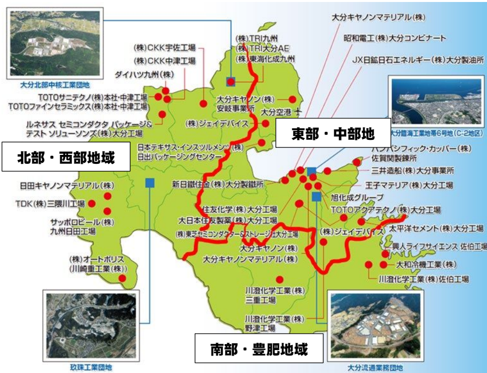
図表 12 主要企業の立地状況、3つの経済圏