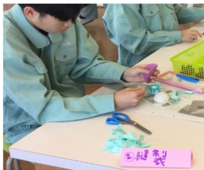
手芸に関する作業の様子

特別支援学校では、「職業」の授業を中心に、作業に関する学習を行っています。作業の学習では、作業種に関係なく、子どもの働く意欲を培いながら、将来の職業生活や社会自立に向けて基盤となる資質・能力を育むことを目標に指導・支援しています。