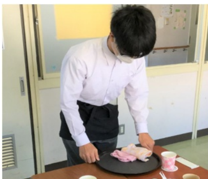
喫茶サービスに関する作業の様子