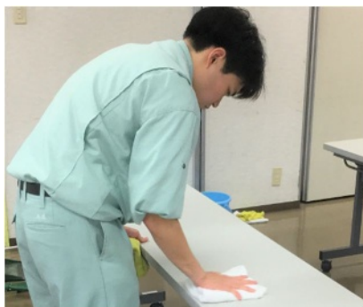
メンテナンスに関する作業の様子