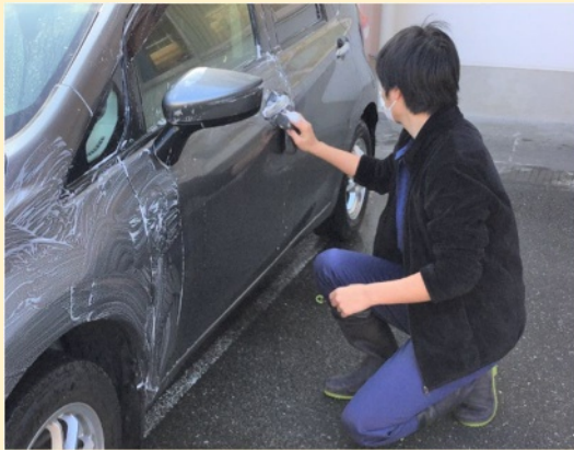
洗車作業（大分支援学校）