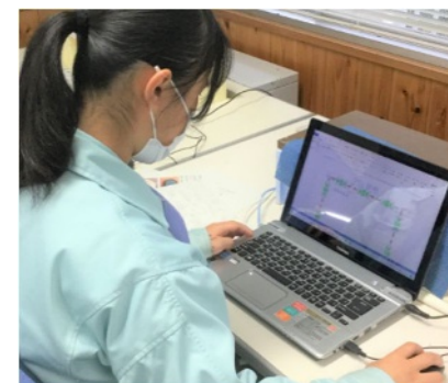
名刺作りに関する作業の様子

右の二次元コードを読み込むと、実際の作業の様子を視聴することができます。子どもたちの実際の学習の様子を是非ご覧ください。