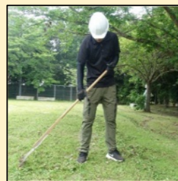
中津支援学校の実習の様子

※現場実習を実施したら採用しないといけないということではありません。就労に結びつくのが理想的ですが、実習の経験をその後の学習や進路選択に役立てることが目的です。