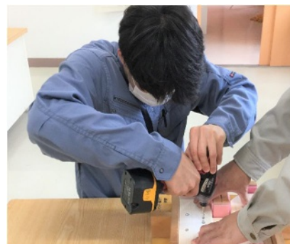
木工に関する作業の様子