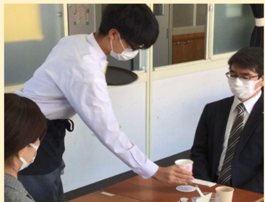
喫茶サービス作業（南石垣支援学校）