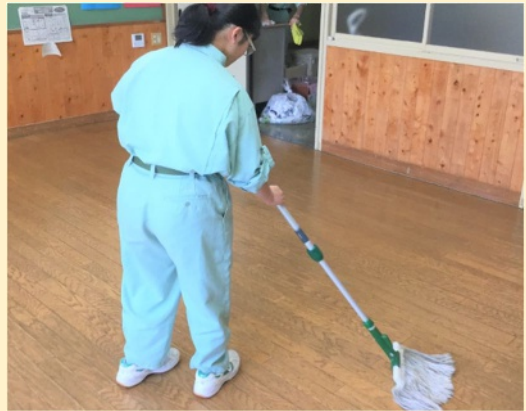
メンテナンス作業（新生支援学校）