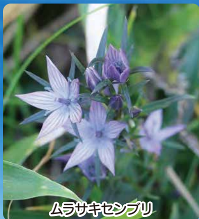
ムラサキセンブリ