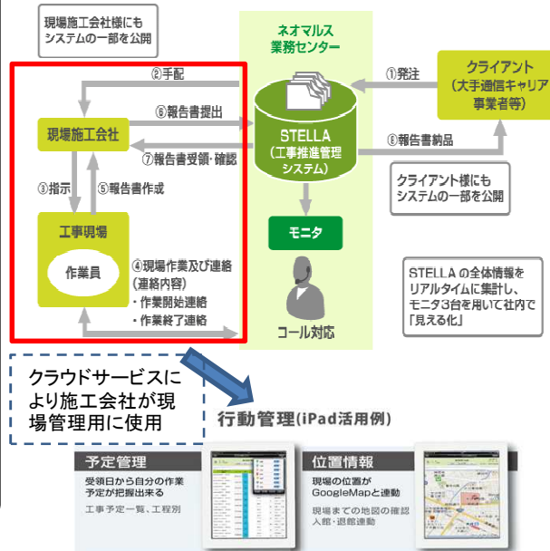
<①クラウドサービス イメージ図>