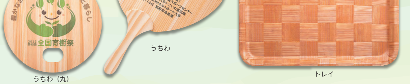
ポケットティッシュケース うちわ トレイ