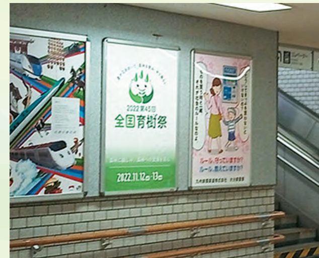
JR各駅構内ポスター