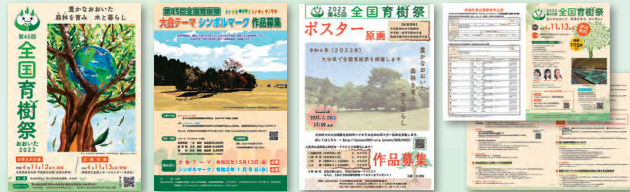
大会ポスター 大会テーマ・シンボルマーク募集チラシ 大会ポスター原画募集チラシ 式典参加者募集チラシ