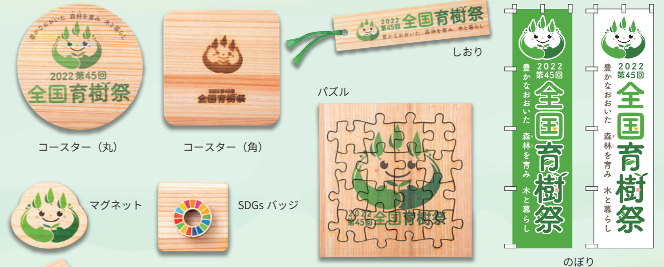
コースター(丸) コースター(角) マグネット SDGs バッジ パズル のほり