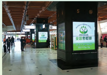
デジタルサイネージ