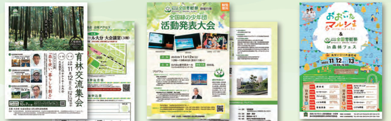
育林交流会チラシ 全国緑の少年団活動発表大会チラシ おおいたマルシェ&森林フェスティバル