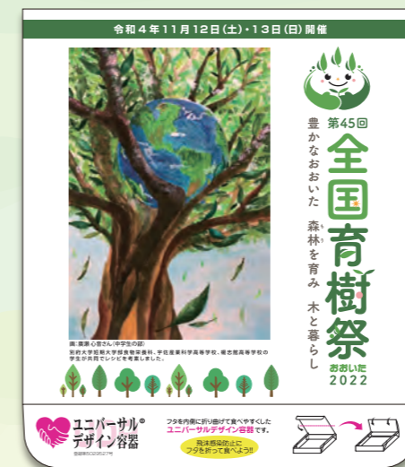
おもてなし弁当パッケージデザイン