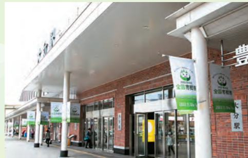
大分駅南口フラッグ