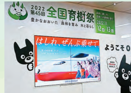
大分駅改札横大型壁画装飾