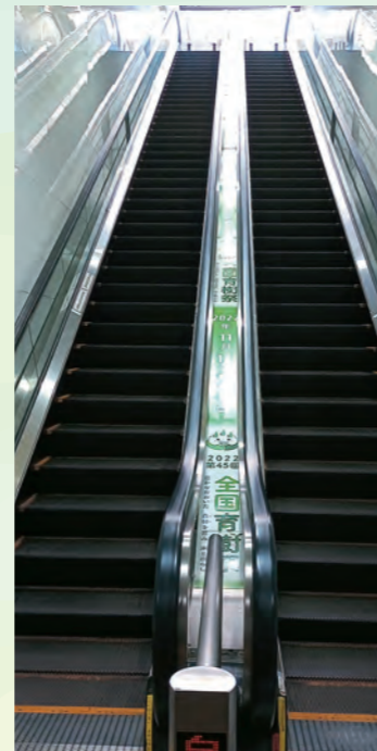
大分駅エスカレーター装飾