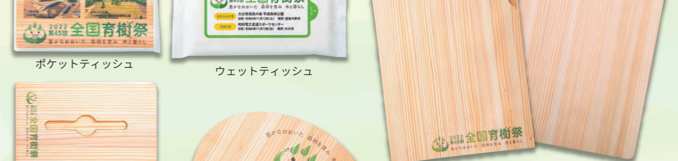
絆創膏 マスク A4 ファイル A4 バインダー ウェットティッシュ