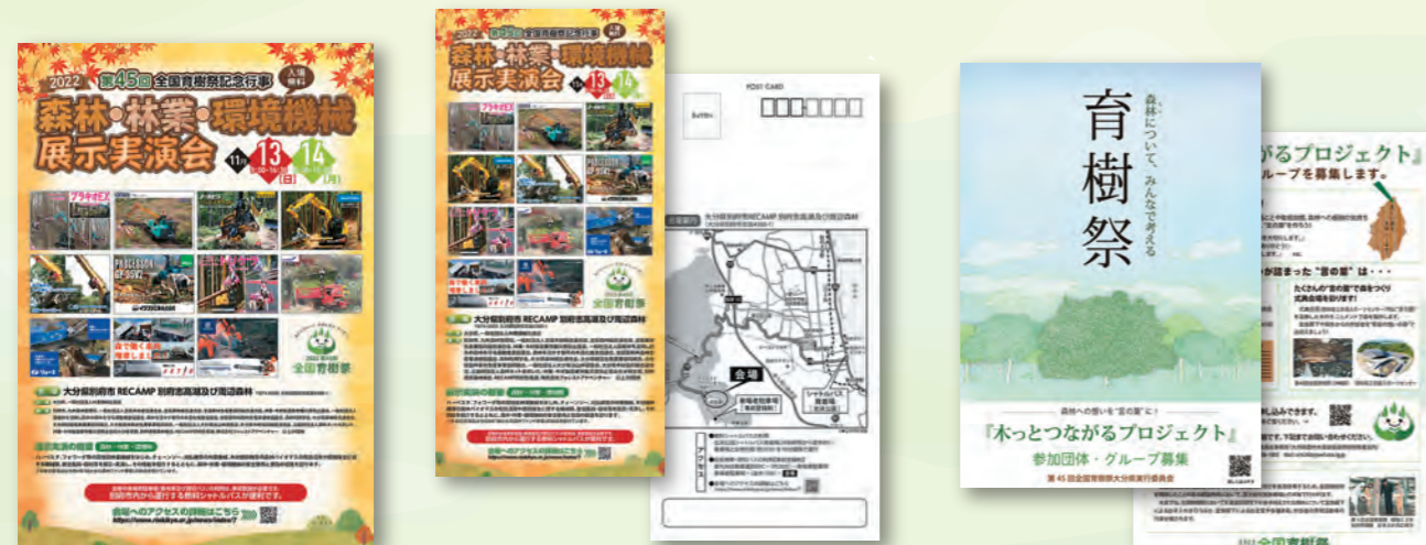
森林・林業・環境機械展示実演会ポスター 森林・林業・環境機械展示実演会ポストカード 木とつながるプロジェクトチラシ