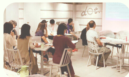
昨年開催時の様子

都市部で働きつつ、 地方の新しい暮らし・生き方に興味がある方、 地域創生に興味がある方、 大募集! 「来て、会って、考える」 大分県内で活躍するメンターとつながり、 共に課題解決に取り組むプログラムです。