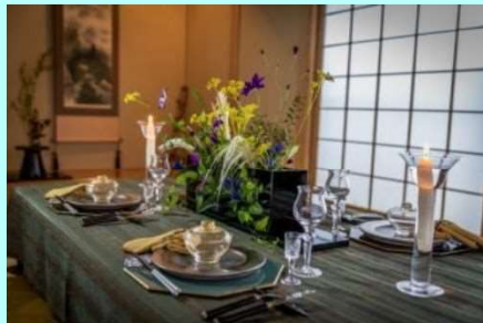
(例) 飲食店で生け花教室