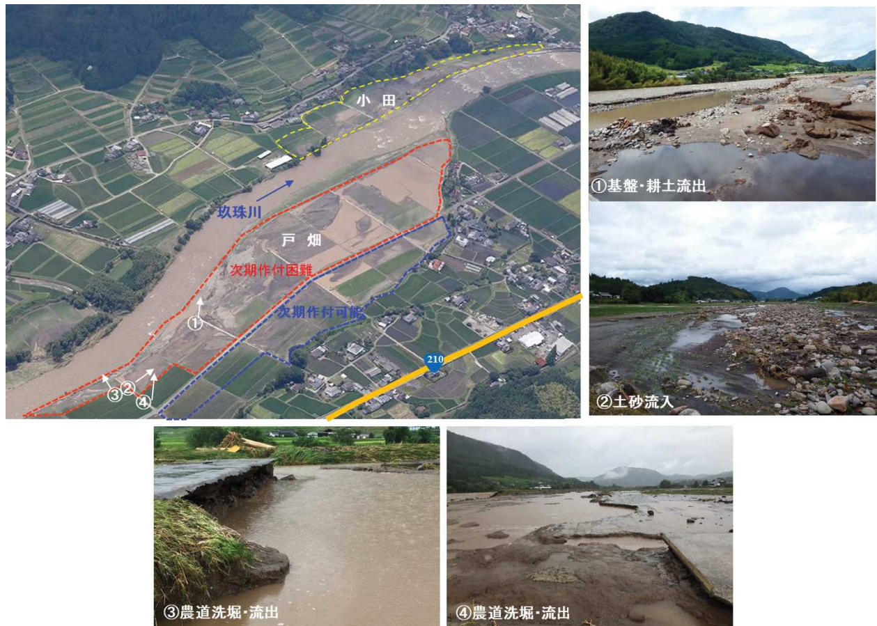
農地・用水路（戸畑）

農家からの農地大区画化の要望を踏まえた改良復旧による農地再生が課題となっている。このため、次期作可能な箇所については、作付け前の令和3年5月までに土砂を撤去する。また、地元、県、町が連携して、水田農業の生産性向上を目指す営農方針について協議を進め、改良復旧の合意を図るとともに、被害の少ない水田も含めた大区画化を実施する。