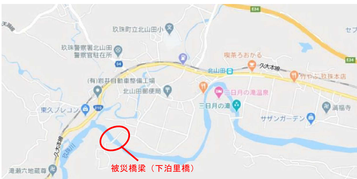
町道下泊里線 下泊里橋（戸畑）

復旧にあたっては、仮設の人道橋の検討、災害査定に係る復旧工法の検討や施工監理等が必要となることから、県による技術支援を行う。