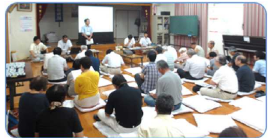
▲説明会の様子 ▼地質調査の状況

現在は、乙津工区の測量・調査・設計を重点的に行っています。今年度実施した主な内容(予定を含む)は以下のとおりです。