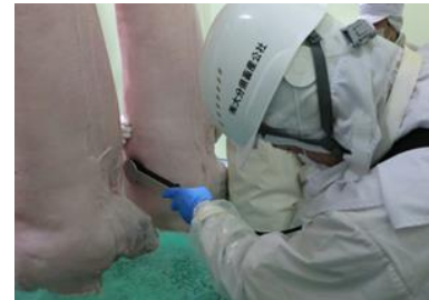
図2 食肉脂質測定装置による豚枝肉のオレイン酸値の測定