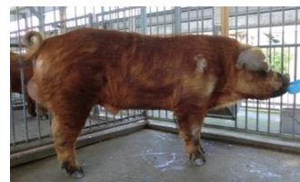
増体の良好な止め雄 デュロック