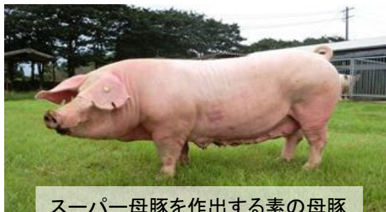
スーパー母豚を作出する素の母豚 GP;ランドレース