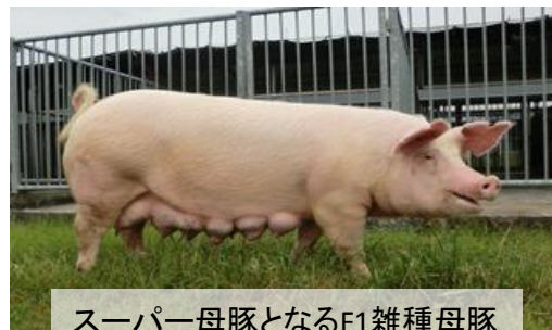
スーパー母豚となるF1雑種母豚 ランドレース × 大ヨークシャー