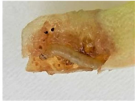
果実内のトマトキバガ幼虫