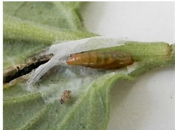
トマトキバガの蛹（繭の中）