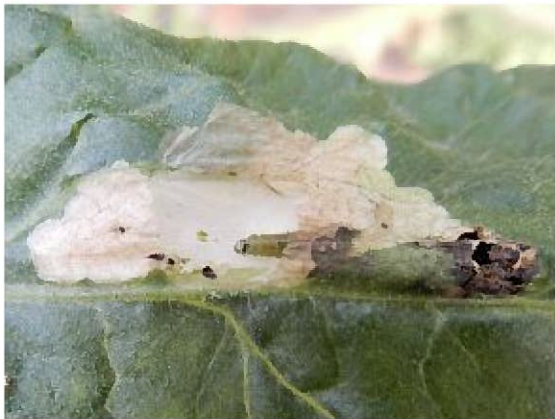
被害葉の中のトマトキバガ幼虫