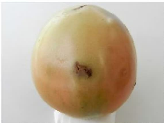
幼虫によるトマト果実の食害