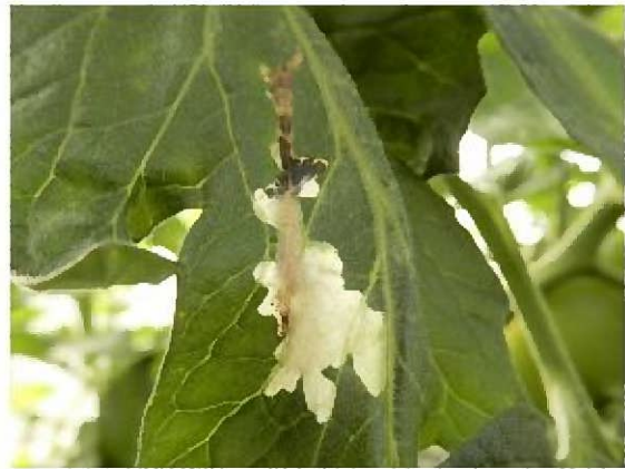
トマトキバガ幼虫による被害葉