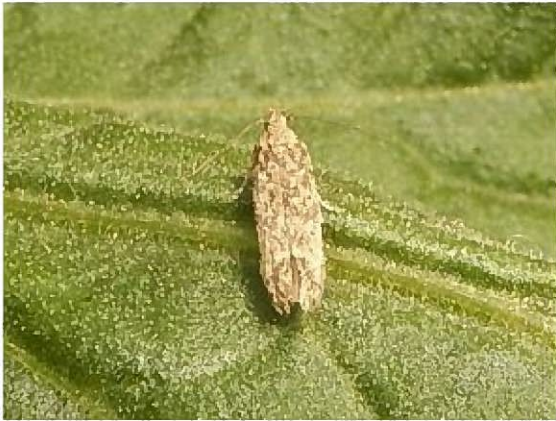
トマトキバガ成虫