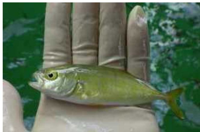
端境期出荷に向けて生産されたブリ人工種苗