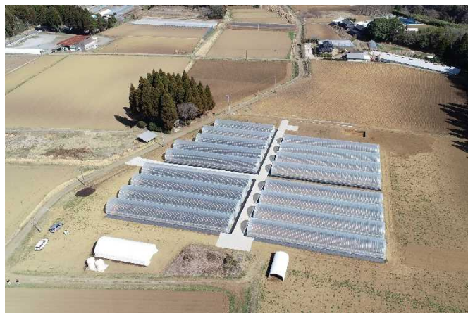
5組7名が就農する「スタートアップファームたけた」