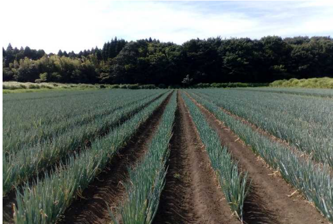
100億円プロジェクトが進む白ねぎ