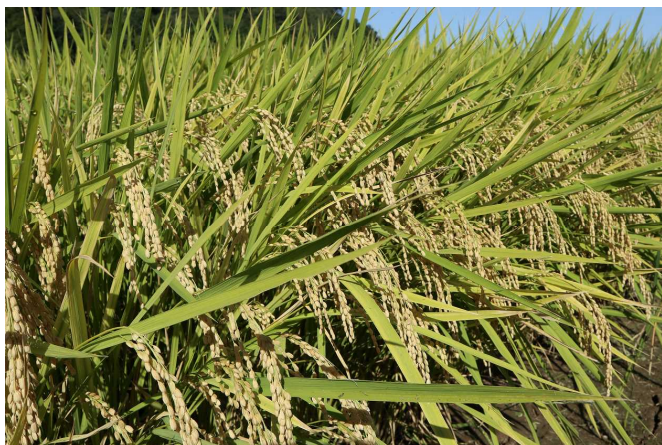
栽培が進む高温耐性品種「なつほのか」