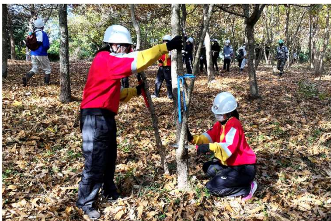
第45回全国育樹祭1年前プレイベントにおける育樹活動