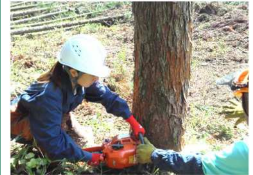
担い手の確保・育成