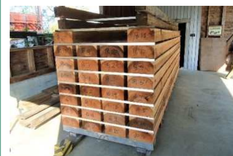
高品質乾燥材生産の技術開発