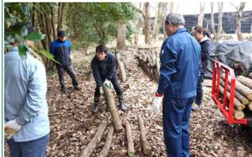
普及員による研修会