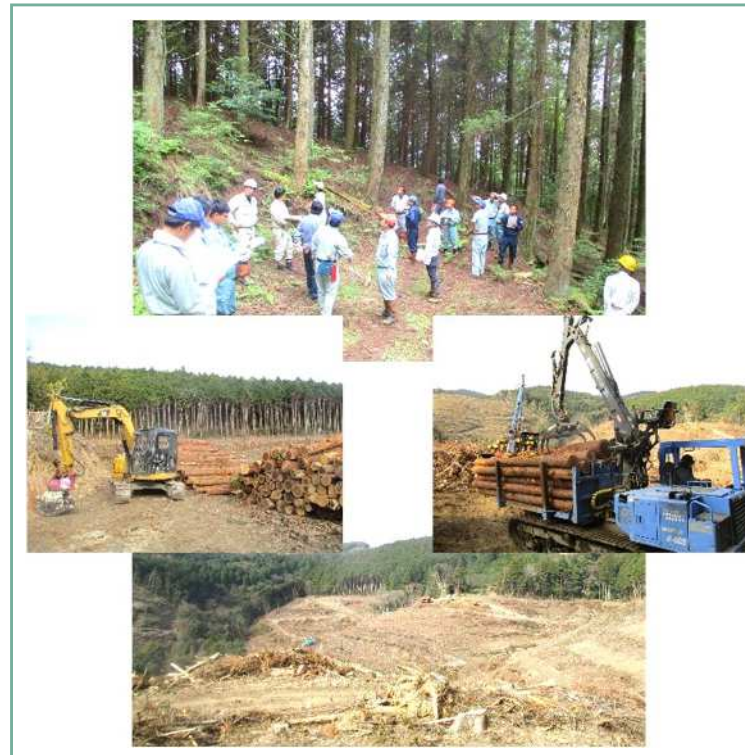
県営林の主伐地状況（植栽のための地拵え状況）