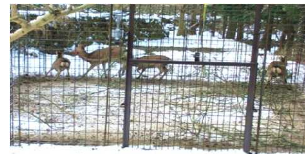
ICTを活用したニホンジカ捕獲