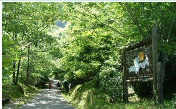
水源かん養保安林・保健保安林 兼種指定 (竹田市荻町大字陽目)