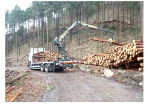
林業専用道を使った木材の搬出