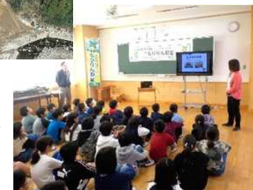
小学校へのお出前講座↓