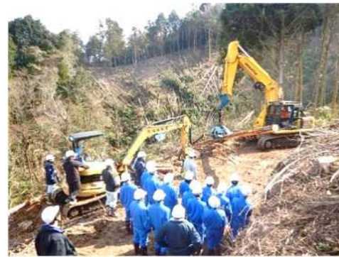
高校生のための林業職場体験