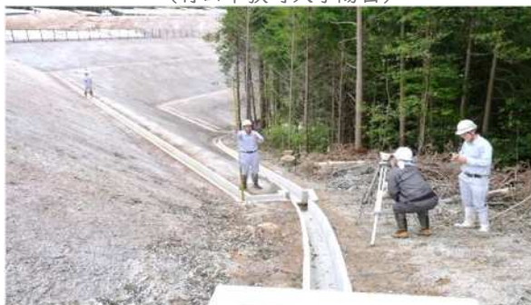
林地開発許可(太陽光発電施設)完了確認