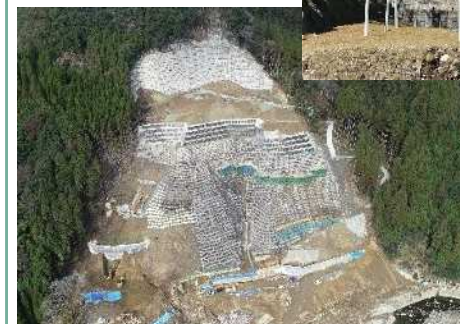
↑ 山腹工と 地すべり防止工事