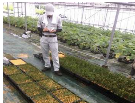
造林用優良品種の選抜