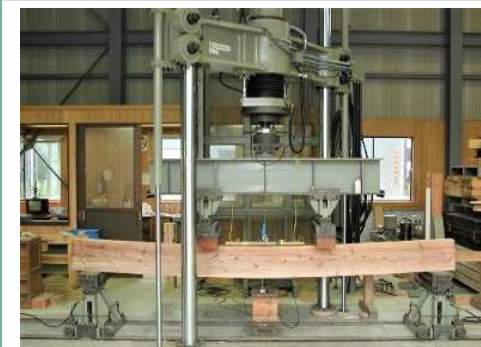
県産スギの強度性能評価