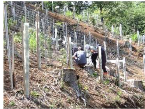
早生樹モデル林の設定