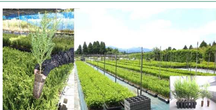
スギコンテナ苗の増産の推進