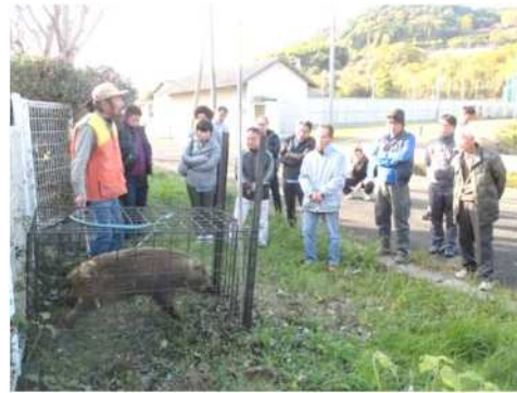
わな猟のためのスキルアップセミナー