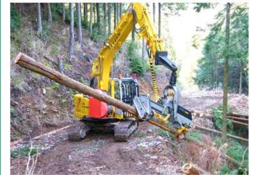
高性能林業機械の導入