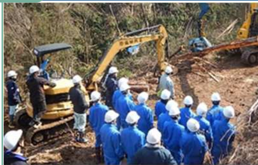
普及員による研修会