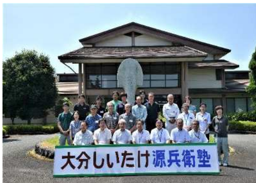
生産者のための 研修会