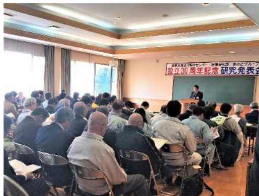
研究成果の 発表会