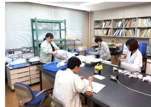
シイタケの 形質調査