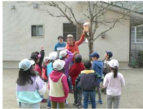
森林環境税を活用した森林教育