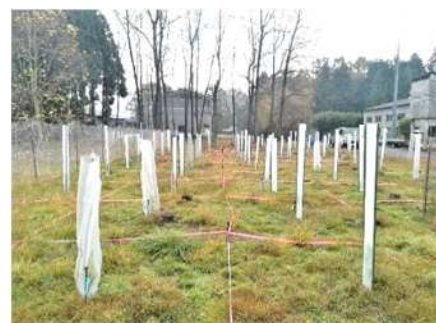
獣害防除技術試験