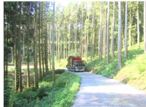
林業専用道（竹田市）