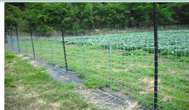
畑に設置された防護柵