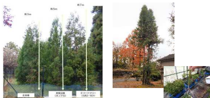
早生樹・エリートツリーの普及