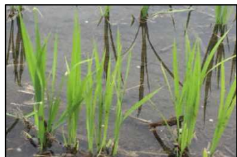
入水始。4~5葉期(6/22: 播種+34日)