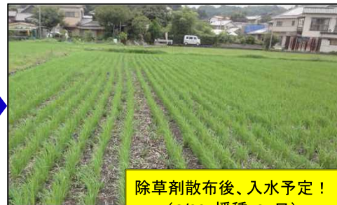
除草剤散布後、入水予定！(6/29: 播種+37日)