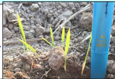
出芽数が増えてきました(5/31: 播種+12日)