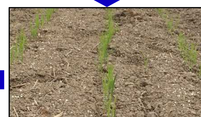
すじ条になってきました(6/5: 播種+17日)