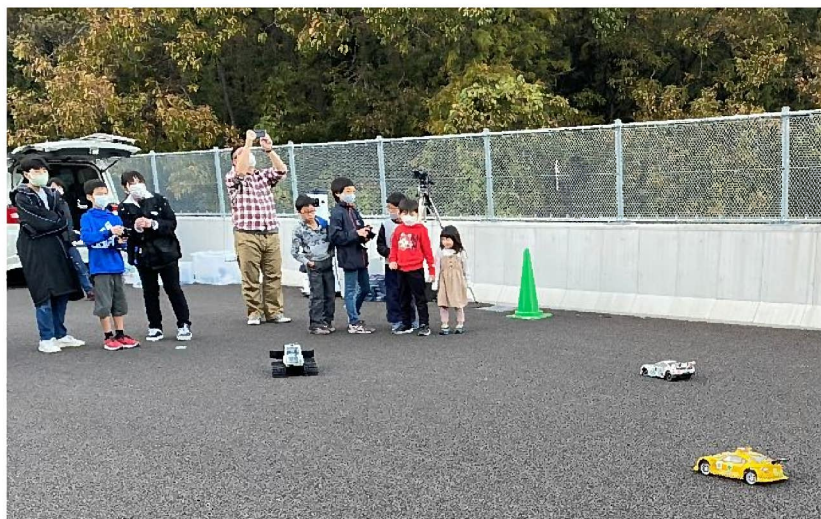
ラジコンレース(関崎海星館)