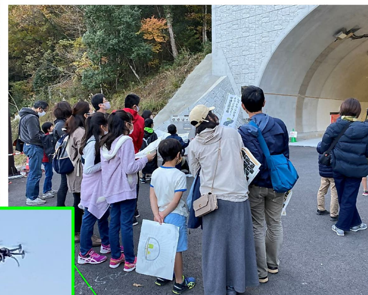
トンネルに興味をもってもらいました