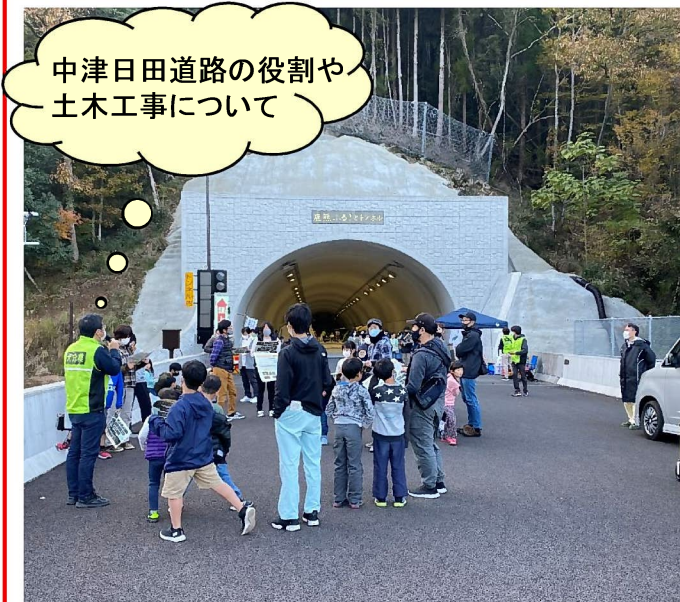
中津日田道路現場説明