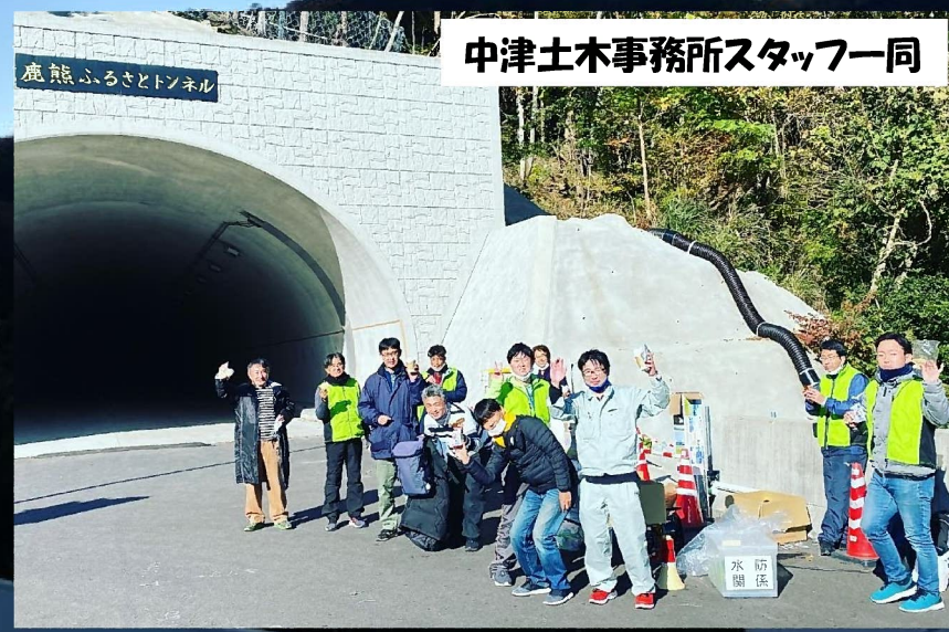
中津土木事務所スタッフ一同