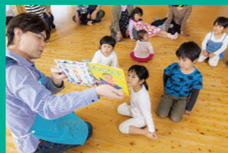
男性の子育て参画の促進 パパクラブによる読み聞かせ