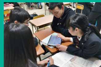
ICTを活用した教育の推進 タブレットを活用した授業