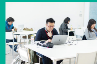
未来に向けた企業立地の推進 姫島村のサテライトオフィス