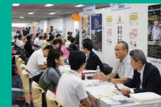
UIターンの促進 首都圏での移住相談会