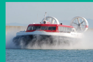
九州の東の玄関口としての拠点化 空港への海上アクセスの実現に向けた取組