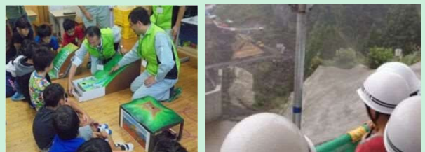
出前授業の様子 玉来ダム建設現場の見学会 (佐伯市立木立小学校)