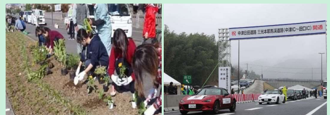
地域と協働の維持管理 (道路沿線での植栽活動) 道路の開通イベント