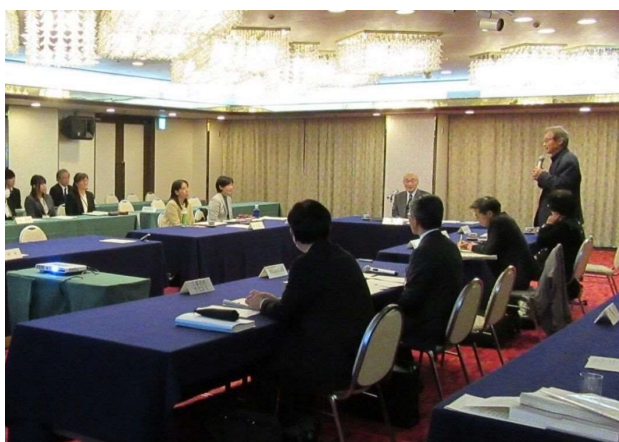
事業評価監視委員会の状況

平成30年度の事業評価監視委員会では、土木建築部、農林水産部あわせて事前評価対象2事業、再評価対象18事業、事後評価対象3事業の計23事業が審議され、各々の対応方針案について「妥当」であるとの審議結果が知事あてに答申されました。