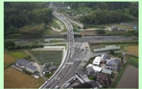
国道500号 檜本工区（宇佐市）