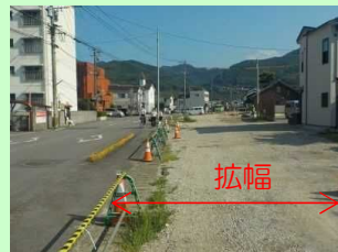
(都)祇園洲柳原線(整備中)