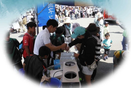
H30. 5. 5 玖珠町童話祭