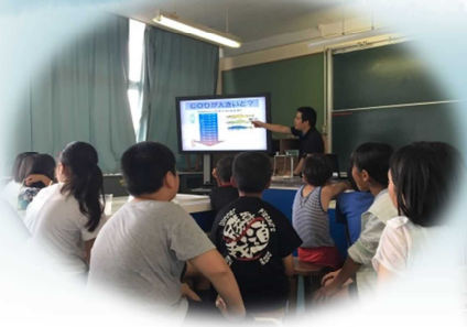
H30. 6. 26 武蔵東小学校