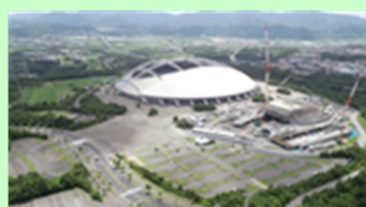
大分スポーツ公園