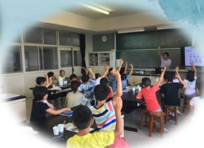
H29. 7. 13 白杵小学校