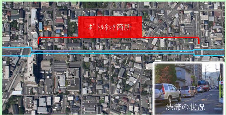
ボトルネック解消 ((都)山田関の江線：別府市)