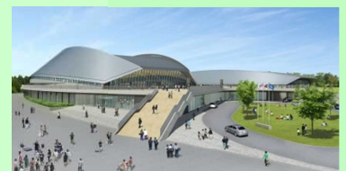
武道スポーツセンターイメージパース図