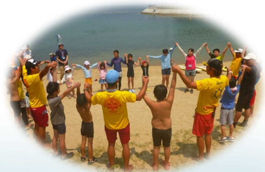
H30. 8. 5 田ノ浦ビーチ「マリンスクール '18」