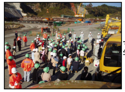
ダム工事で使用する大きな機械を見学しました。