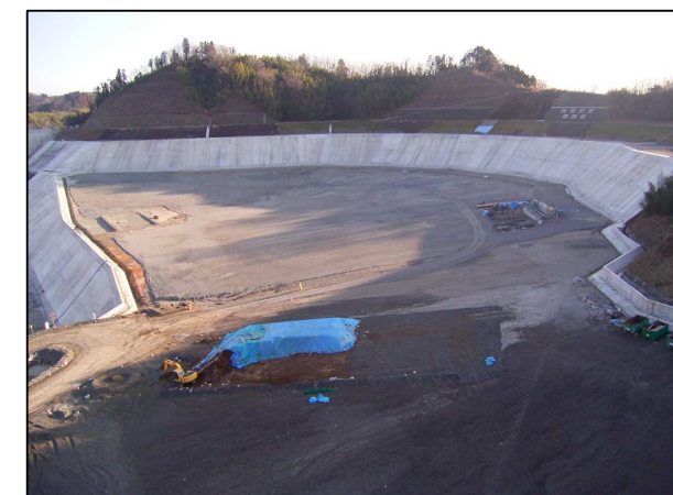
右岸貯水池対策工状況