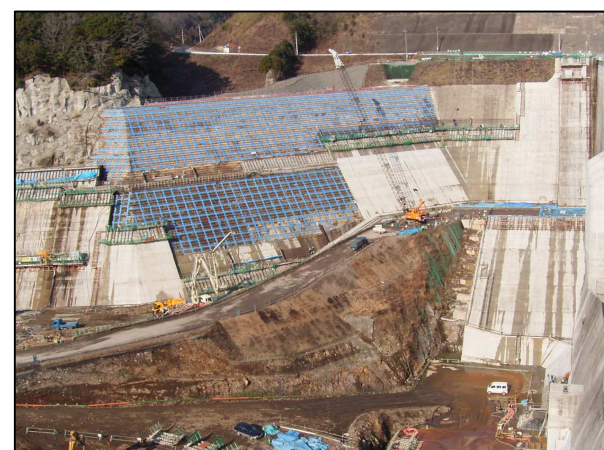
左岸(下流部)貯水池対策工状況