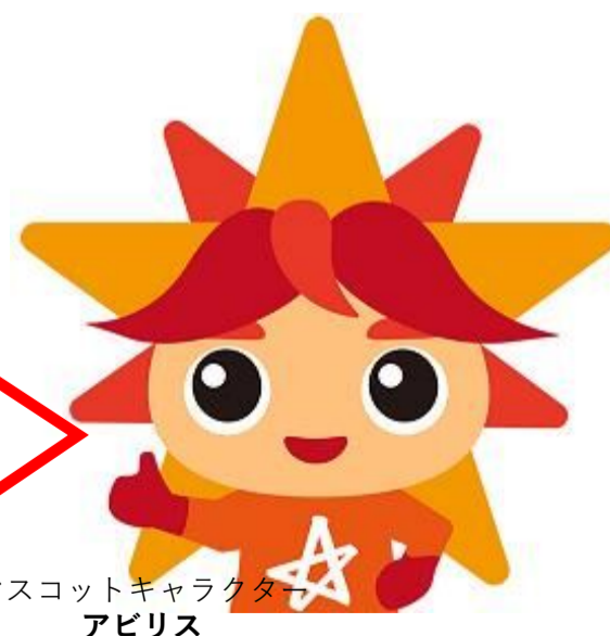
マスコットキャラクター アビリス

今大会も入賞者の方に、協賛企業から豪華な 副賞 を贈呈! 皆さまのチャレンジをお待ちしています! 支援学校や障害者就労施設による食品等の販売やクラフト体験といった楽しいイベントもあるので見学に来てください! 来場者の方には、 スタンプ を集めて応募いただくと素敵な プレゼント が貰えるチャンスも!