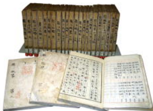
『縣治概略 第一巻～第二十五巻』