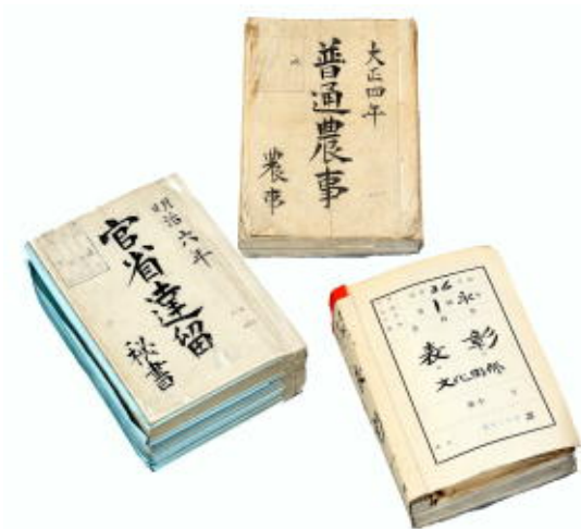
上：『普通農事 大正四年』/農事課 左：『官省達留 明治六年』/秘書課 右：『表彰 文化関係』/秘書公聴課

大分県公文書館では、明治4年の廃藩置県で大分県が誕生した以降の公文書を保存しています。