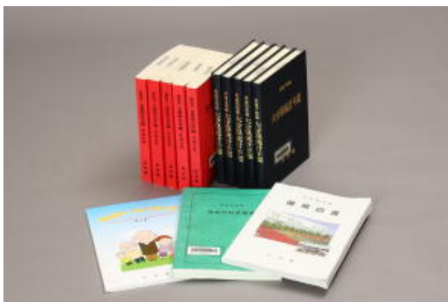
上段左：『公衆衛生年鑑』 上段右：『大分県統計年鑑』 下 段： 白書等

おもに、冊子やパンフレット・ポスターをはじめ、ビデオテープやCD-ROMなどの電磁記録媒体もあります