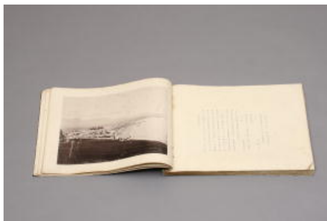
『大分県写真帖』（明治40年発行）