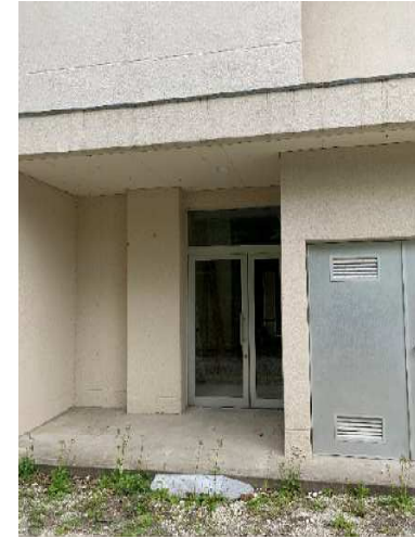
西側唯一のガラス扉