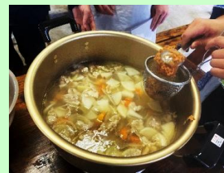
<アウトドアクッキング>