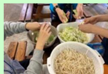
<アウトドアクッキング>