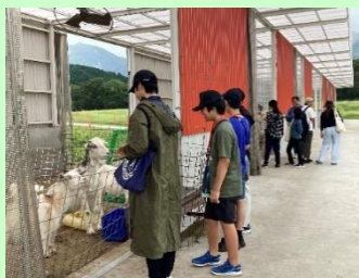
<動物ふれあい体験>