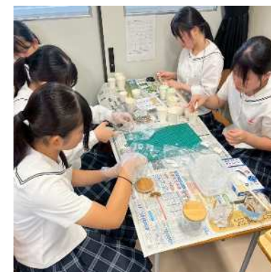
▲廃油キャンドル制作