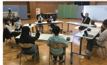
中津市立小楠小学校での意見交換会