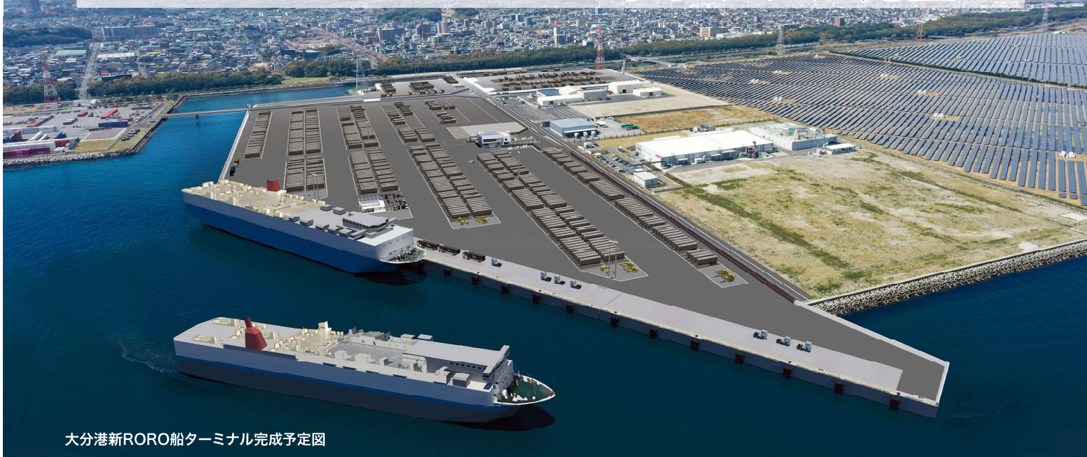
大分港新RORO船ターミナル完成予定図