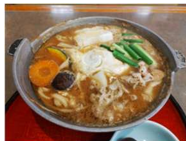
みそ煮込みうどん