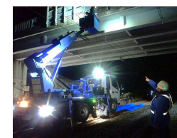
跨線橋の点検 (地域一括発注)