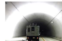
レーザーと高解像カメラを搭載した専用車両による走行型のトンネル点検