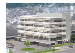
別府総合庁舎 ※建設イメージ (ZEB Ready認証取得)