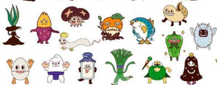
おいしいモンスター