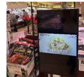
サイネージを活用したレシピの紹介