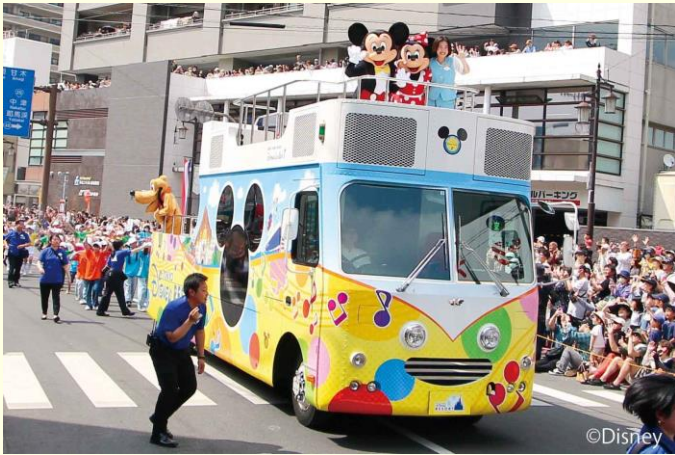
东京迪士尼度假区®游行照片

去年5月25日至26日，举行了为期两天的“第77届日田开河观光祭”。 本次观光祭上，迪士尼小伙伴们从东京迪士尼乐园专程远道而来，在水乡日田周日狂欢节上带来热情洋溢的表演！ 本次游行，共迎来71000名参加者，有人不禁随着音乐起舞。“达菲巴士”也在龟山公园展出，带来阵阵欢声笑语。