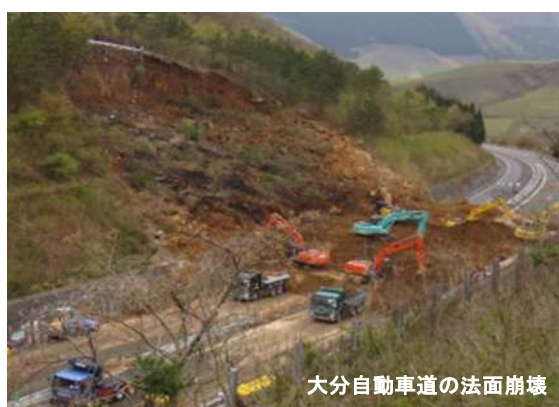
大分自動車道の法面崩壊

令和6年には、4月に豊後水道を震源とする地震が発生し、佐伯市、津久見市で震度5弱を観測したほか、同年8月に発生した日向灘を震源とする地震では、初めて南海トラフ地震臨時情報（巨大地震注意）が発表されるなど、近年では全国各地で地震が頻発している。