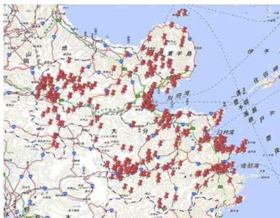
地図の出典：国土地理院ウェブサイト