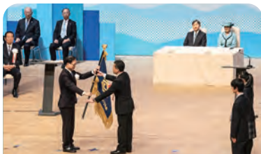
次期開催県(三重県)へ大会旗の引継