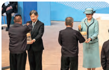
稚魚などのお手渡し