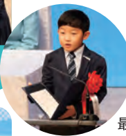
最優秀作文の発表