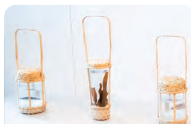
お手渡し容器(別府竹細工)