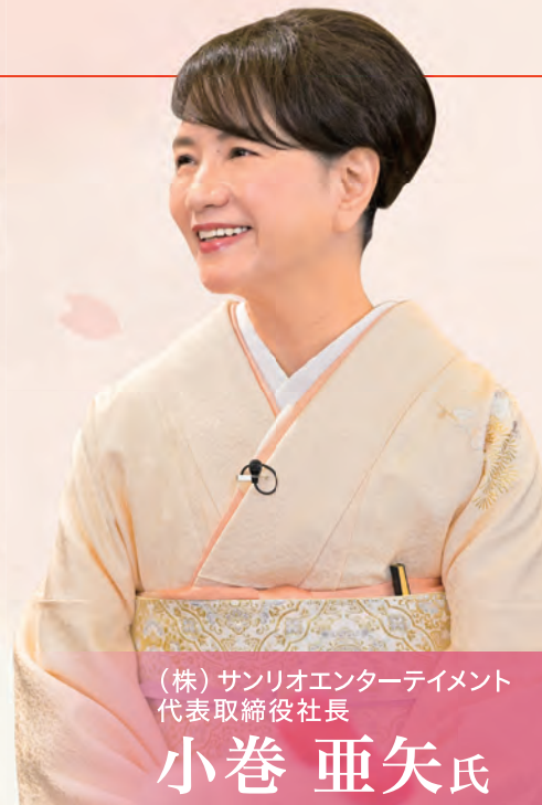
(株)サンリオエンターテイメント 代表取締役社長