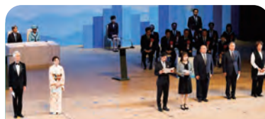
海づくりメッセージ