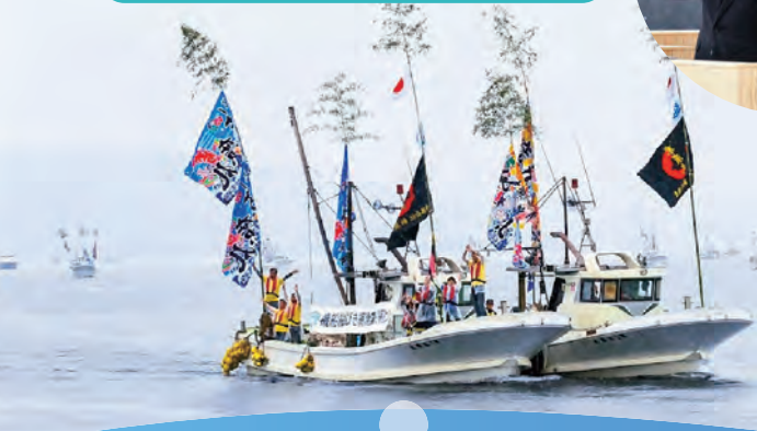
漁船などによる 歓迎パレード