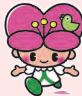
大分県人権啓発 イメージキャラクター-こころちゃん