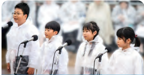
放流合図を行う児童(別府市)