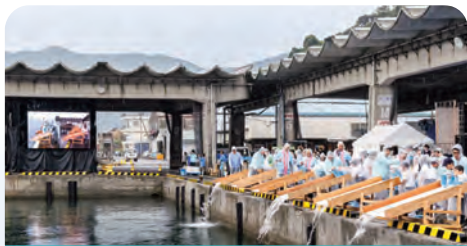
同時放流の様子(佐伯市:松浦漁港)