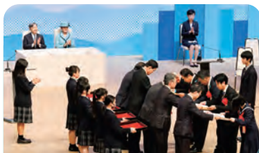
表彰式 (功績団体表彰・作品コンクール)