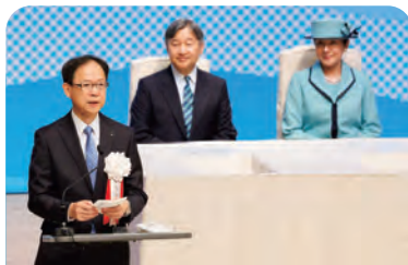
主催者あいさつ(県知事)

「大分は全国でも有数の水産物の産地。長年にわたる皆さんの努力に深く敬意を表します。豊かな海づくりの輪が大分の地から全国へ、未来に向けて大きく広がっていくことを願います。」